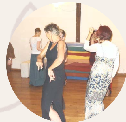
Körperübungen, Bewegung, Tanztherapie

"Ich möchte mich frei bewegen und trotzdem in Kontakt zu anderen Menschen sein"