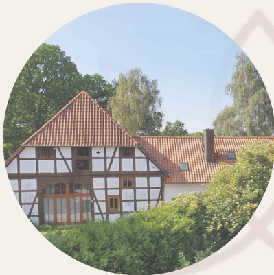
Selbsterfahrung im sicheren Raum

"Ich habe meinen eigenen Schutzraum in mir."